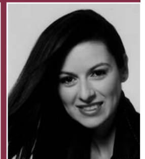
Chen Reiss Sopran