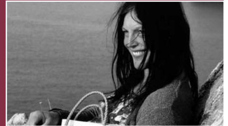
Angela Winkler Alma Mahler